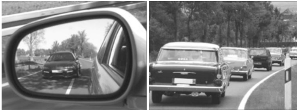
Abb. 4: Typische Praktiken von Anhängern modifizierter (Bild links) und originaler PKW (Bild rechts) 11

Automobils wird durch die Maskierung der Scheinwerfer an den Innenseiten erzielt, so dass die ›Augen‹ des Autos für vorausfahrende Automobilisten entsprechend schlitzartig und ›böse‹ erscheinen können. Die Opposition des Original-Konzepts zeigt sich anhand des Bilds eines originalen Volkswagens (Abb. 3, Bild rechts). Zentral hierbei ist einerseits das Fehlen gestalterischer Eingriffe in das Designkonzept des vom Unternehmen hergestellten Produkts und andererseits die Akzentuierung des ›historischen‹ Charakters des Automobils durch auf dem Dach befestigte ›Accessoires‹. In diesem Fall versucht der Besitzer des Automobils den Charakter des Marken-Originals durch die (temporäre) Installation eines alten Koffers und von ein paar Skiern (aus Holz) zu betonen. Der Effekt: das Auto wirkt wie aus einer anderen Zeit, es bekommt einen musealen Charakter und erscheint als besonders schützenswertes Kulturgut.