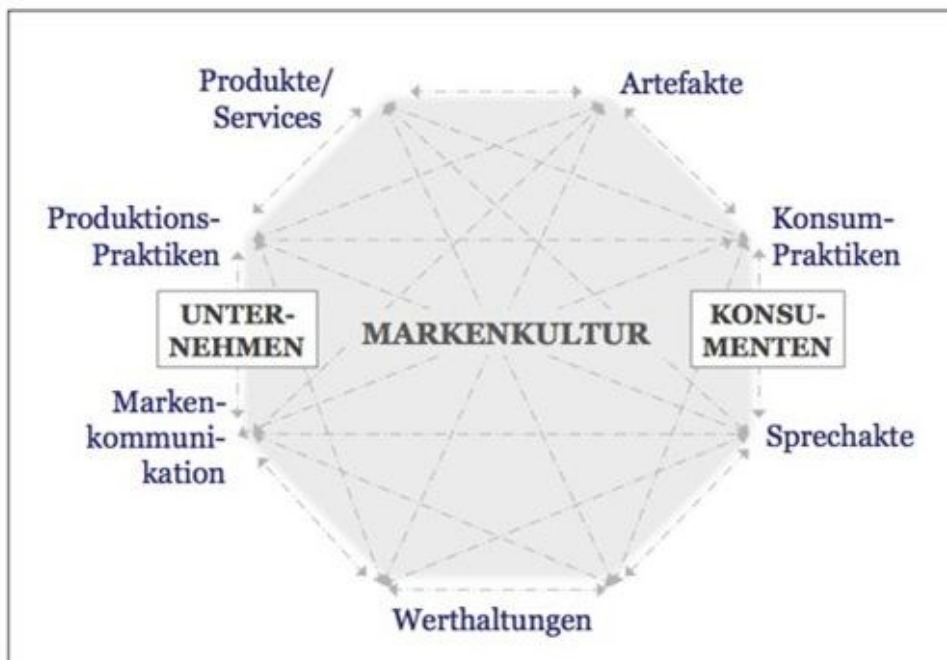
Abb. 2: Modell der Markenkultur