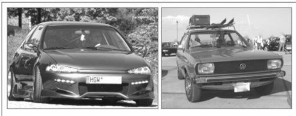
Abb. 3: Typische Automobile von Anhängern modifizierter (Bild links) und originaler PKW (Bild rechts) 9

Diskurse werden in Anlehnung an Siegfried Jäger als ›Felder des Sagbaren‹ verstanden (JÄGER 2001: 83). Das bedeutet: Diskurse sind Ensembles, die Aufschluss darüber geben, ›wer was wo wann‹ sagen darf. Demnach können die zentralen Bilder auf den Brand Community-Sites, wie Logos oder die Site prägende Gestaltungselemente, als von den Mitgliedern der BCs legitimierte Abbildungen und Aussagen verstanden werden, anhand derer sich essentielle Deutungen der Brand Communities innerhalb der Diskurse ableiten lassen. Neben Werthaltungen haben sich ›Artefakte‹, ›Praktiken‹ und ›Sprechakte‹ im Rahmen der Diskursanalyse der Community-Kultur als besonders fruchtbare Datenquellen erwiesen. Diese Erkenntnisse sind in ein erweitertes Modell der Markenkultur eingeflossen (Abb. 2), welches als Grundlage für die Bilddiskursanalyse gedient hat. Im Folgenden werden erstens Bilder von Artefakten, 8 zweitens Bilder von auf die Automobile bezogenen Praktiken und drittens (visuelle) Sprechakte der BC auf ihren Beitrag zur Klärung der Deutungsmuster kurz analysiert und dargestellt.