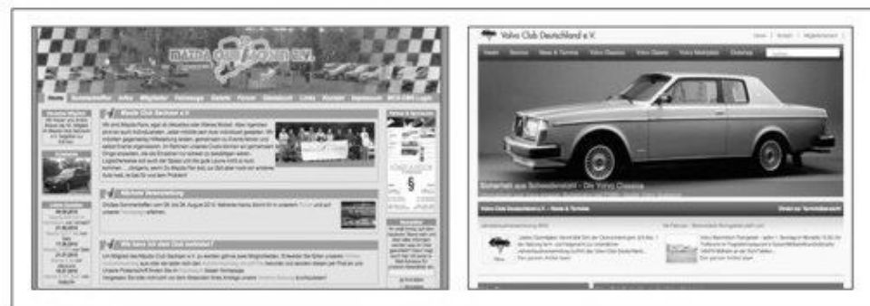
Abb. 5: Typische Websitedesigns von Anhängern modifizierter (Bild links) und originaler PKW (Bild rechts) 193

Abstand zwischen den Automobilen, die den Eindruck erwecken in gemütlichem Tempo (aber dafür ›beieinander‹) über die Straße zu gleiten.