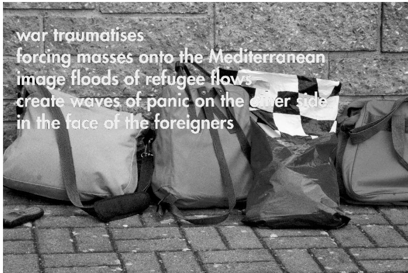
Abb. 1: Stefan Römer: Welcoming Culture 2015 (Daypacks), vierteilige Foto-Text-Montage, S/W-Fotografie, 65 x 44 cm, 2015.