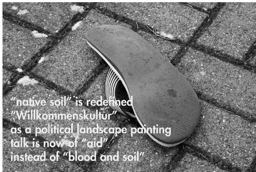
Abb. 3: Stefan Römer: Welcoming Culture 2015 (Flipflop), vierteilige Foto-Text-Montage, S/W-Fotografie, 65 x 44 cm, 2015.