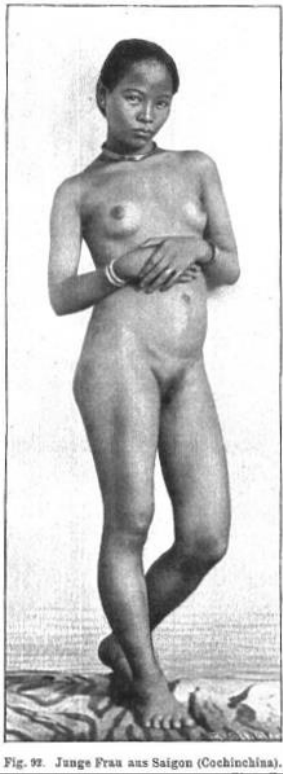
Fig. 92. Junge Frau aus Saigon (Cochinchina).