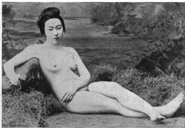
Fig. 47. Japanerin. Choshiutypus.