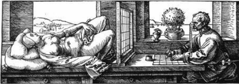
Abb.1: Die perspektivische Seh-Konfiguration bei Albrecht Dürer (1525)