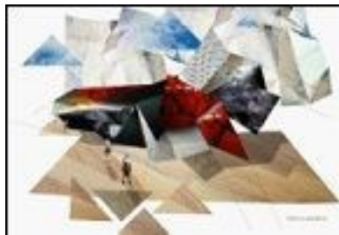
Abb. 4: Zukunftsbild (WERNER 2010)

Um diese Kriterien ermitteln zu können, hat sie Collagen in Testreihen erstellt, die sie dann mittels Leitfadeninterviews bewerten ließ. Die Bildfolgen variierten sowohl in Form, Farbe, Material, Struktur und in der Perspektive. Alle verschiedenen Bildfolgen wurden innerhalb ihrer Gruppe nach einem festgelegten Schema variiert.