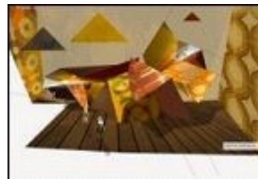
Abb. 5: Zukunftsbild (WERNER 2010)

Frei nach dem Motto ›Am liebsten erinnere ich mich an die Zukunft‹ von Salvatore Dali, kann festgestellt werden, dass sich die Vorstellung der Zukunft aus den Erfahrungen der Vergangenheit generiert. Die Anknüpfung an Bekanntes ist ein wichtiges Kriterium für die Bildakzeptanz, allerdings sollte der Anteil an Bekanntem und Neuem ausgewogen sein. Überwiegt das Bekannte (Form, Material, Farbe, Struktur, Muster), werden die Bilder häufig als Bilder der Vergangenheit eingeordnet.